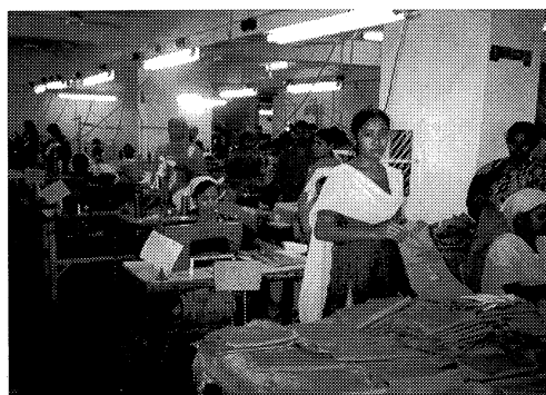
Bangladesh縫製工場働く女工さん達

ミレニアム開発目標は途上国のみならず先進国も含む世界全体に要請された目標である。これを達成できなければ、先進国の姿勢も問われてしかるべきである。これまで先進国の国際協力パフォーマンスの程度を計る合意された基準はなかったのであるが、昨年アメリカのCenter for Global Development (CGD) という研究所が policy coherence という概念を打ち出し、先進国の政策