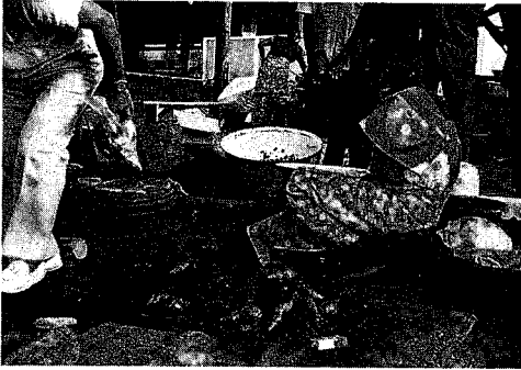
熱帯雨林地帯の有力な蛋白源となっている 特大かたつむり。最近、その養殖実験が 成功、当地の話題となった。

の拡張禁止という決定をくだすに至った最大の原因は、上記のような国際市況の低迷にあったことは明らかである。しかし、同時にこの決定には、コートジボワールのココア栽培の質的改善という意味もこめられているようである。年間、100万トンの生産をめざして推進されてきたココア栽培奨励政策は、木材の乱伐とともに、コートジボワール南部の原生林の急激な減少という犠牲をともなった。コートジボワールの原生林面積は過去80年間に1500万haから400万haに減少したと推計される。これ以上の減少は単に国富の喰いつぶしにとどまらず、生態系的にも問題だといわれている。そこで本年は、「森林の年」と銘打って、原生林の保護、再植林計画が国民運動として展開されている。