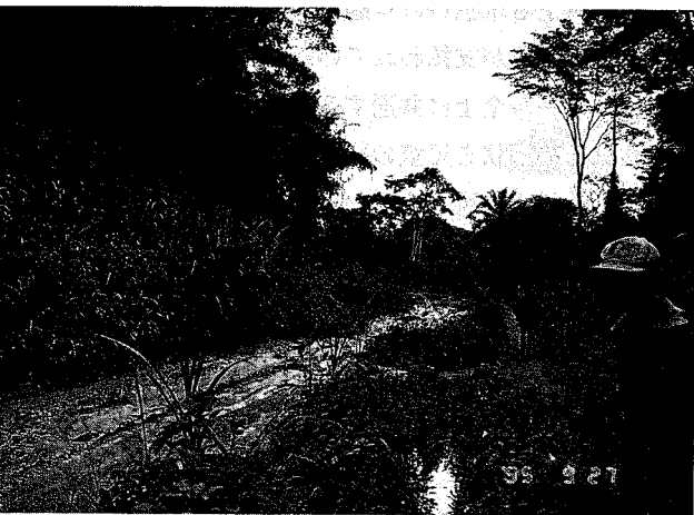
熱帯林のなかの道路。まったく手入れされておらず、泥だらけ、穴だらけで車の通行は難渋をきわめる。自転車が一番早く目的地に着く。

先に進むとさらに道は悪く、次の60㍍を通り抜けるには2週間を要するとのことであった(写真)。