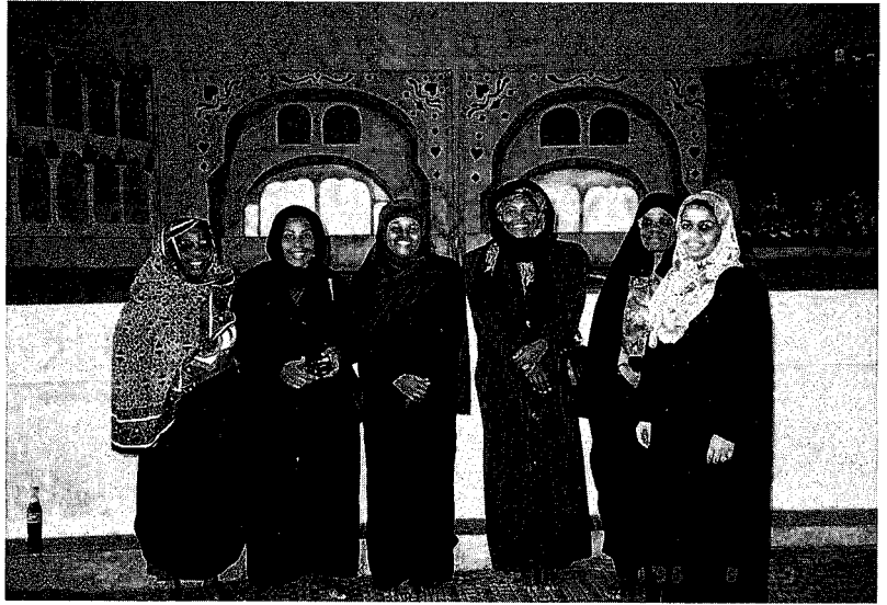
ムスリム女性協会の コミュニティメンバー

第7章がある。同研究は、レレママ（1890年代から1930年代にかけて流行したムスリム女性のダンス）グループとの比較の視点から、ムスリム女性組織が性別隔離からの脱却に果たした意義を評価する一方で、エリート女性主導型の組織ゆえの限界や、女権拡張よりも自らの宗教や民族の利害を優先した点を指摘している。本稿は、同研究を手がかりに筆者が1996年および97年の夏に実施した現地調査のデータにもとづくものである。