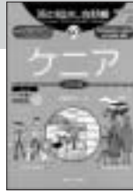
旅の指さし会話帳60 ケニア 宮城裕見子 著

スワヒリ語会話の入門本にしかみえないタイトル、それほど変哲のない背表紙。スワヒリ語が必要ない人、逆に何度もケニアを訪れているような人は、おそらく本書の前を素通りしてしまうのではないだろうか。そこをなんとか、ぜひ少し立ち止まって手にとってみていただきたい。