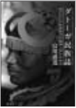
ダトーガ民族誌 - 東アフリカ牧畜社会の地域人類学的研究 富川盛道 著

「甦るアフリカ研究のバイオニアワーク」と帯にあるとおり、著者の富川氏(故人)は、今西錦司らが中心となって1960年代に実施された、京都大学アフリカ類人猿学術調査隊の中心メンバーであった。この調査隊のなかで富川氏は人類班の責任者をつとめ、東アフリカの牧畜民ダトーガの調査を行った。本書は富川氏が生前に執筆したダトーガ研究の成果を一冊にまとめ、あらためて世に問うたものである。