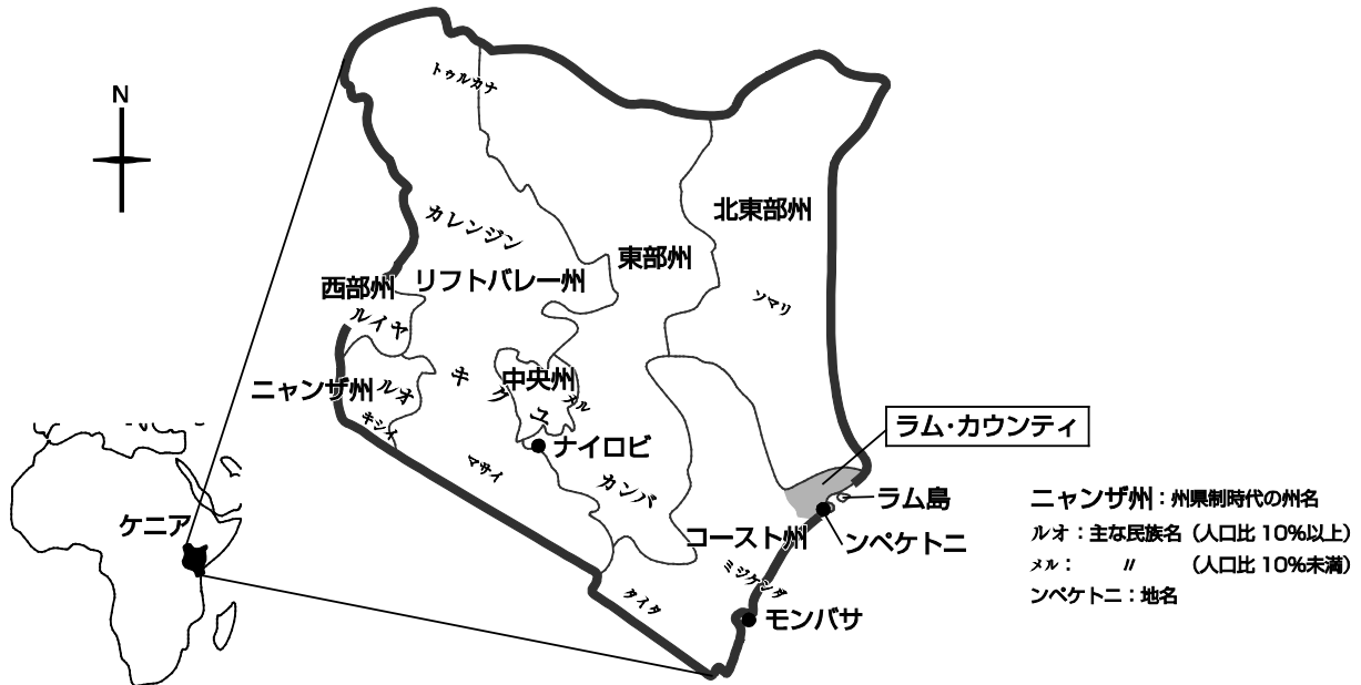
図1 ケニア・ンペクトニの位置

タナ・リバー (Tana River)、キリフィ (Kilifi)、モンバサ (Mombasa)、クワレ (Kwale)、内陸のタイタ/タヴェタ (Taita/ Taveta) の 6 カウンティである。