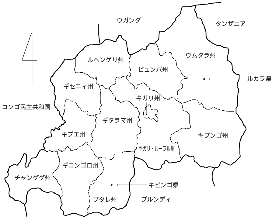
図1 ルワンダの行政区分と調査地の位置

にしている (注22) 。旧難民の帰還が政権交代直後の1994年に集中しているのに対し、新難民の場合は96年にピークを迎え、99年にもなお相当数の帰還が続いている。これは、フトゥ・エリートが政権を掌握していた間に帰還できなかった旧難民が、RPF 政権成立とともに大挙してル