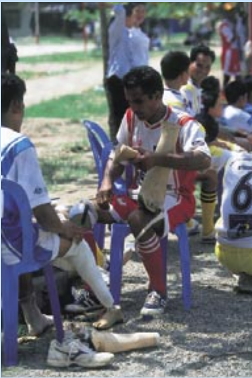
試合の合間に義足の調整を行う選手たち