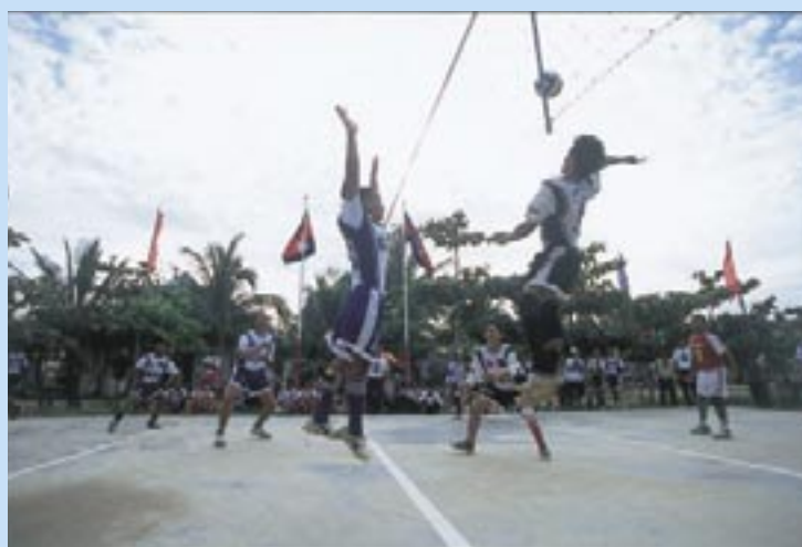
力強い熱戦が繰り広げられる