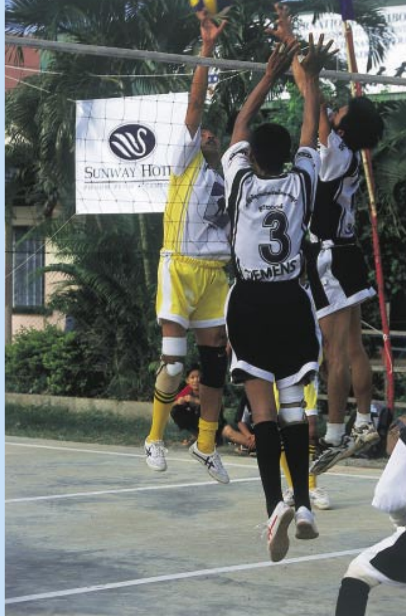
ハイレベルな戦いが続く。3人とも地雷被害者だ（右端の選手は左腕切断）