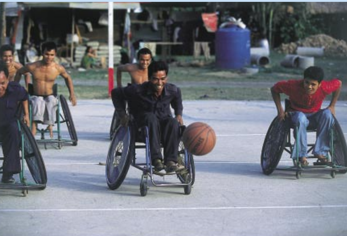
「サバァイ」(楽しい)。スポーツの原点がここにある