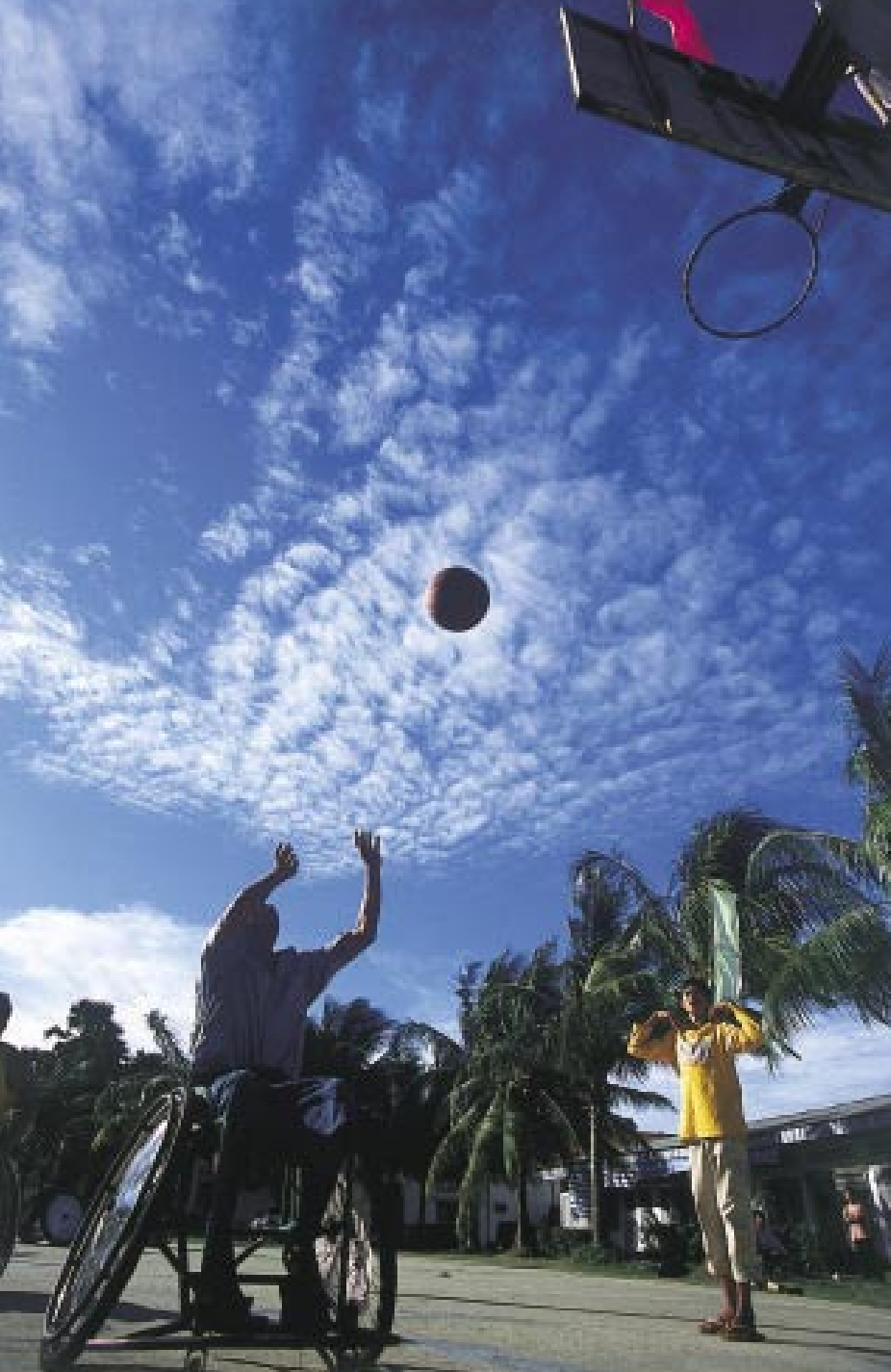
青空の下でシュートを放つ