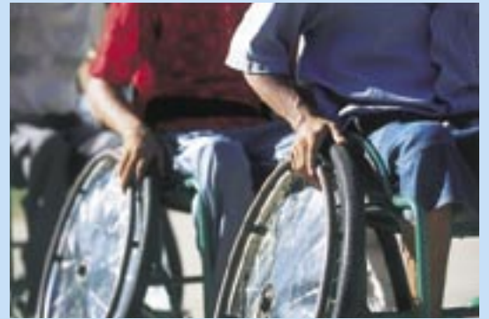
乗用車椅子用を改造した車輪。全てが手作りだ