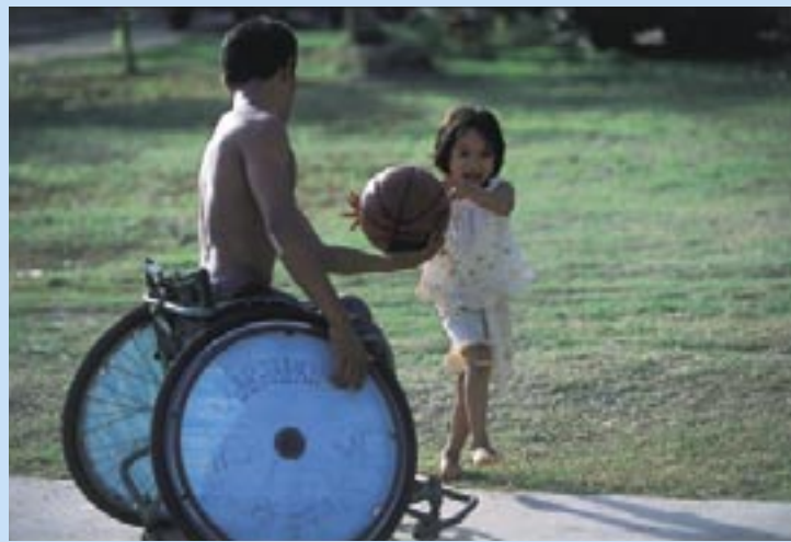
小さなサポーターも選手を支えている

入ってきたカンボジア。しかし、貧困や地雷など、様々な問題が続いている。今でも数百万個も残っている地雷では、年間一〇〇人以上の人々が傷つき続けている。地雷除去や義足の提供など、ハード面での支援はこれまで続いていた。しかし、地雷被害者たちの心のケアは置き去りにされてきた。退院後、自分の村に戻っても、疎外感や孤独を感じ、同じ境遇の仲間がいる病院に遊びに通う被害者もいる。疎外感から村を捨て、都会に出てきて、物乞いをするしかない被害者もいる。そんな被害者たちの心を繋ごうと、今年一月には日本のNGOによってラジオ番組が放送され、大きな反響を受けた。この国で障害者スポーツが盛んになれば、さらに同じ境遇の人々のつながりができ、強いチームになれば、みんなの希望にもなる。バレーボールは、次の北京パラリンピックではメダルも期待できる強さだという。もし、そうなれば、彼らの自信につながるだけでなく、社会的な偏見も、きつと減っていくだろう。現在、バレーボールに続き車椅子バスケットボールもリーグ戦を作ろうと奔走している人々もいる。幸か不幸か選手候補はたくさんいる。「強くなつて、皆に希望を与えたいんだ。」ソパンさんが言う。今、傷ついた人々の心に、希望の光が灯ろうとしている。(いけぐち ひろゆき／(有)ワールドフォト)