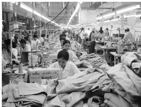
日本向けユニフォームを生産する外資企業。 米国経済制裁後に日本市場へ参入した

の一つである。この時期に国営企業や軍関連企業との合併でなく、独資による進出は珍しい。但し、土地と建物は軍関連企業から借りている。工場長は中国系マレーシア人。制裁前は米国向けに六割、EU向けに四割輸出していた。現在は日本向け九五%、マレーシア向け五%となっている。日本向けにはユニフォーム、作業着を中心に輸出している。制裁前から日本のバイヤーと交渉し、日本市場への参入を準備していた。日本向けは品質要求が高く、これをクリアするのが大変だった。ミャンマーの地場企業が日本市場へ出せる可能性は、ほとんどないと考えているようである。日本向けはGSP（特惠関税）が適用されるので関税はゼロである。制裁前は六〇七工場に下請けに出していたが、現在は自分たちの設備を稼働するのが精一杯である。また、制裁前には外国人技術者二五名が駐在していたが、現在は三名しか残っていない。平均賃金も制裁前の三万五〇〇〇〜四万チャットより、現在は二万八〇〇〇チャットに下がった。今は赤字続きで将来展望も明るくない、とのことであった。以上、米国の主要市場としてきた縫製企業は多く、経済制裁により深刻な影響を受けた様子が分かる。