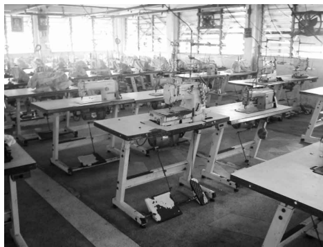
米国経済制裁を受け、遊休化した設備。ヤンゴンの工場縫製工場

ートが存在している。貿易統計がどの為替レートを使って記録されているのか不明である。第二に、同国の輸出には原則として輸出価額に対して一〇%の輸出税が課される(但し、CMP方式の場合には委託加工賃のみが課税対象)。この輸出税を逃れるために、輸出額が過少申告されがちとなる。第三に、品目別・仕向地別の輸出入データが公表されていない。ミャンマー政府が発行する二つの統計集 (Statistical Yearbook 〓 年刊 Selected Monthly Economic Indicators 〓 月刊) には、仕向地別輸出入データ、主要品目別輸出入データが掲載されているが、両者のクロス表は一九九三年の発表を最後に、公表されていない。以上のような問題を踏まえ、本稿では各国別に論じる場合には、できるだけ輸入国側の統計を利用することとする。当然、輸出国側の統計と輸入国側の統計との間には、貿易条件(FOB, CIFなど)や記録される時期(輸送期間)により発生する相違があることにも留意する必要がある。