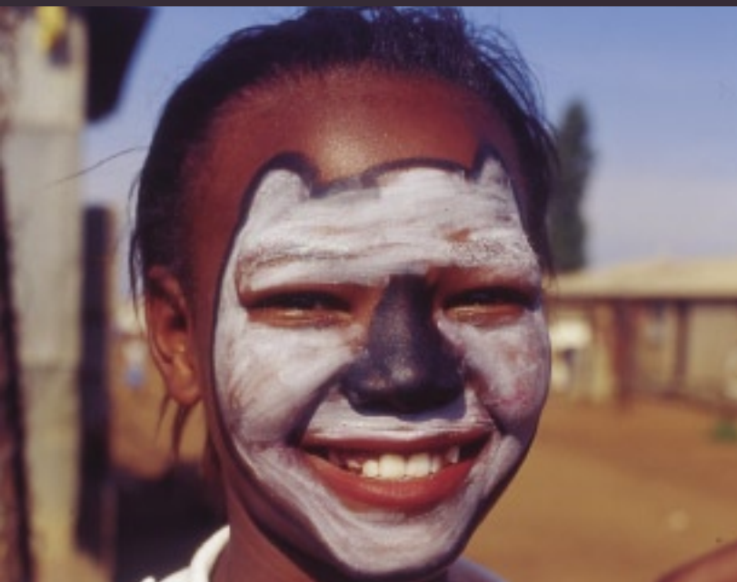
近所の人の結婚式に出席するため、お祝いにちょっとした演出を考えた女の子