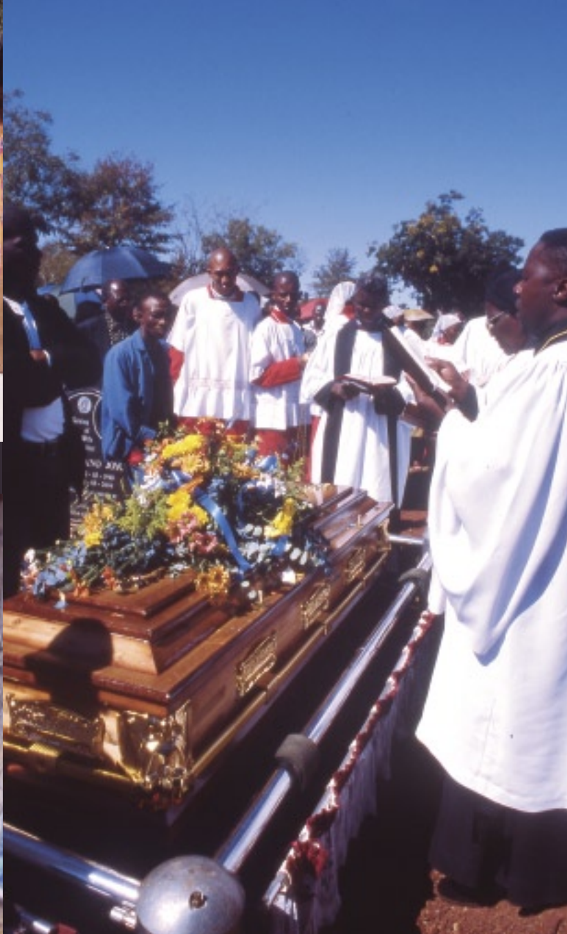
すぐ近所でピストル乱射事件が起き、3人が死亡した。ソウェト郊外にある墓地で行われた葬式