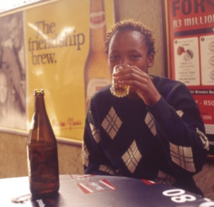
無許可酒場シェビンでビールを飲む女。ビリヤードなどが備えられているところも多い