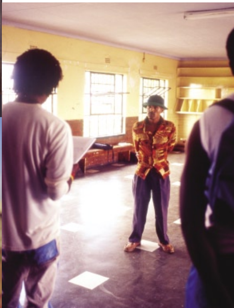
ある演劇集団を主宰するディレクターのテュラネは、空いた公民館を借りて団員たちにレッスンをしていた

四〇万人のうち南アフリカでは五三〇万人が感染、毎年三七万人が死亡している。成人の二割以上が感染者というとてもつもない数字だ。