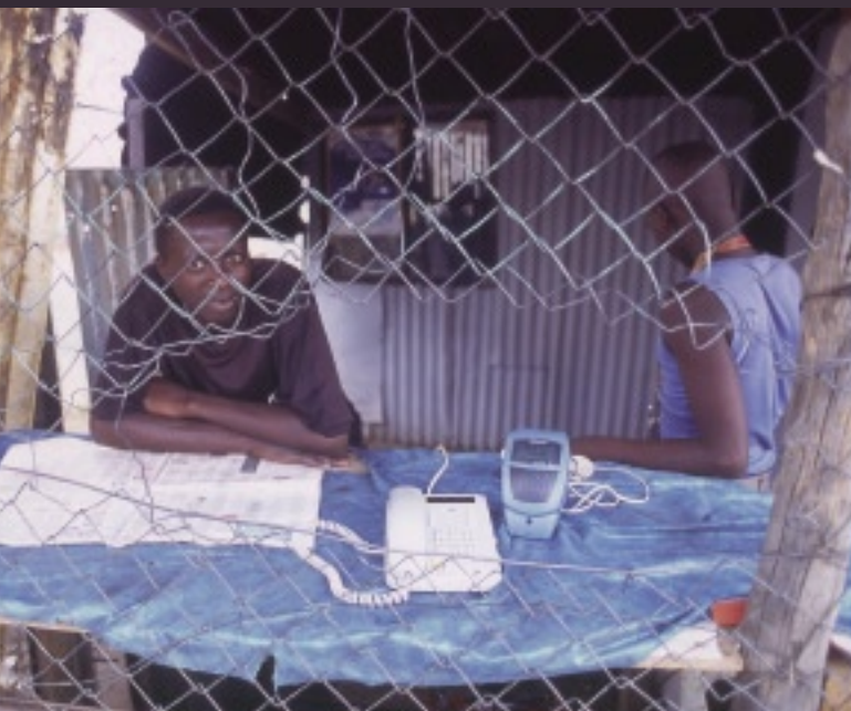
1台の電話機があれば、タウンシップでは十分に商売となる。人々はその日を暮らすためにしたたかに生きている