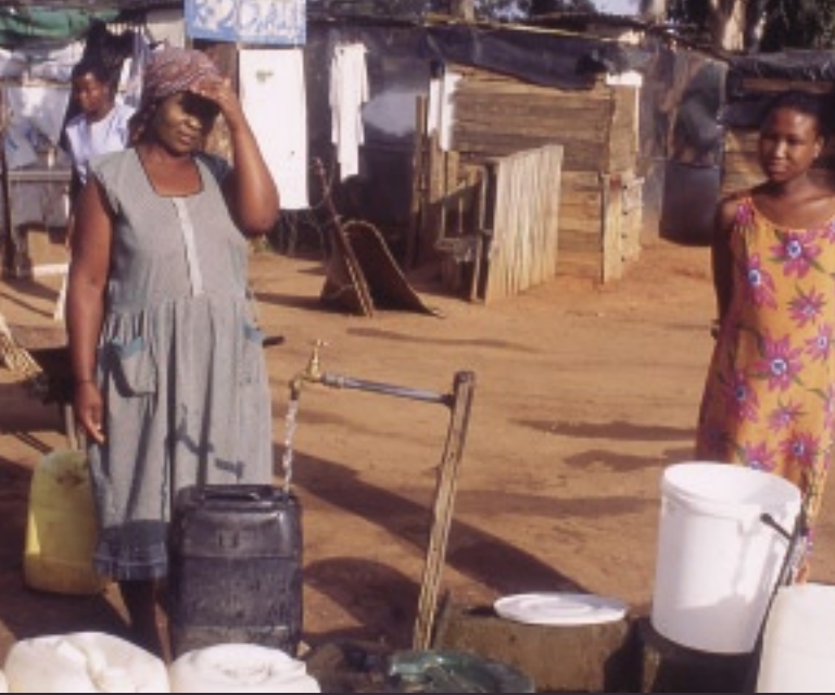
違法な掘立て小屋が並ぶ居住区スクォッター・キャンプでは、水道が整備されていないため、こうして順番待ちに何時間でも並ばなければならないときもある