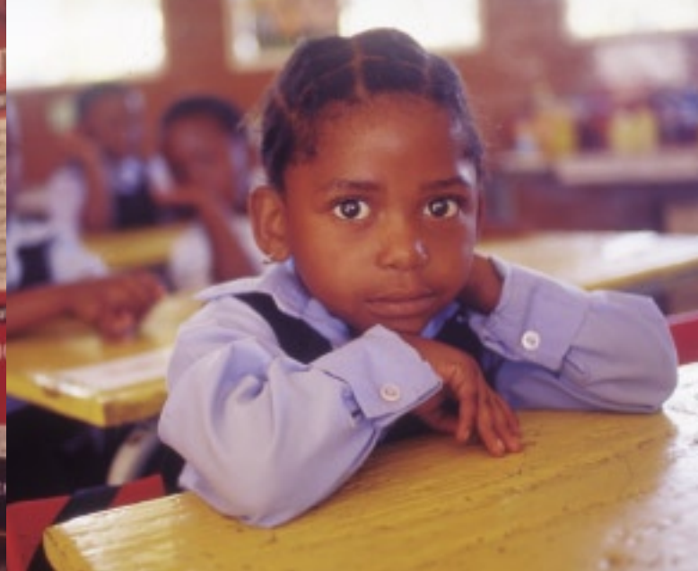
授業を受ける女の子。エイズの蔓延が問題となっているこの国では、小学校の校舎にもコンドーム使用の注意書きが描かれている