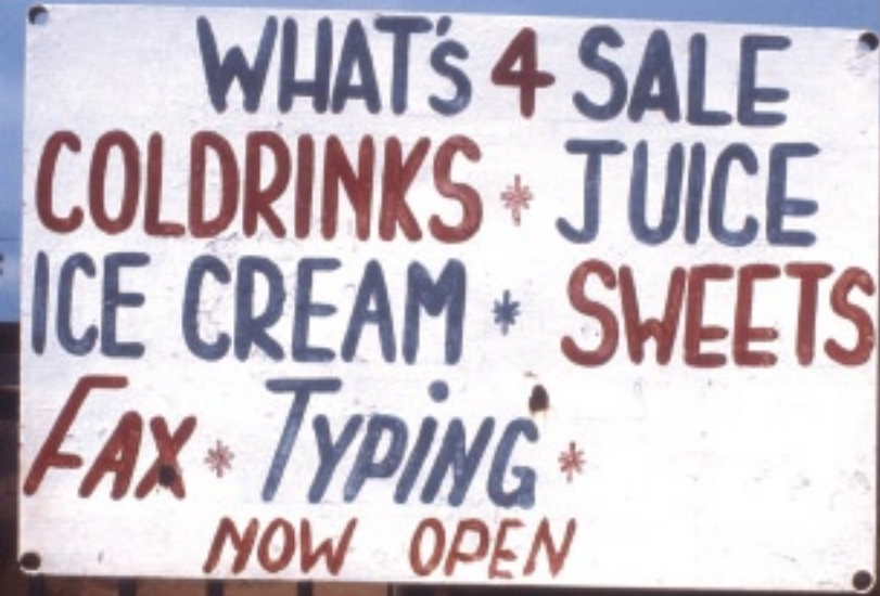
ソウェトには無許可の雑貨屋スパザがあちこちにあるが、こうして看板ひとつを掲げて副収入を得ている家も相当な数にのぼる