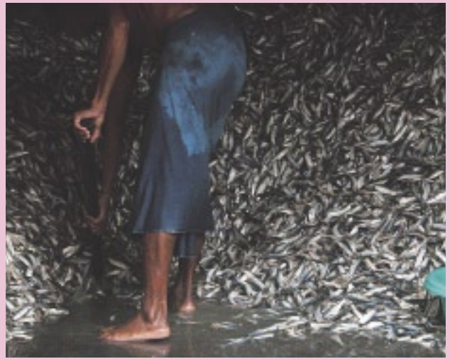
ビルマの人びとの多くは、鹹水魚よりも淡水魚を好んで食べる。イラワジ河で捕れた魚を仕分けする（イラワジ管区）