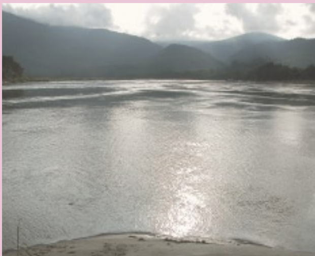
全長 2000km を超えるイラワジ河の出発点ミッソン（カチン州の州都ミッシーナから約 45km。メーカ〔ンマイカ〕河とマリカ河の合流地点）