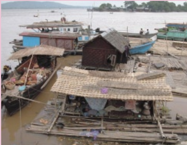
イラワジ河に浮かぶ船で生活する人びと。睡眠中寝返りに失敗して、河に落ちることはないのだろうか (マンダレー)