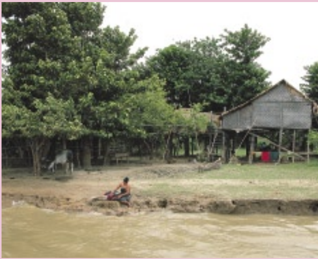
イラワジ河の傍の生活は北から南まで、それほど大きく変わることはない。水浴びと洗濯に精を出す（マンダレー）