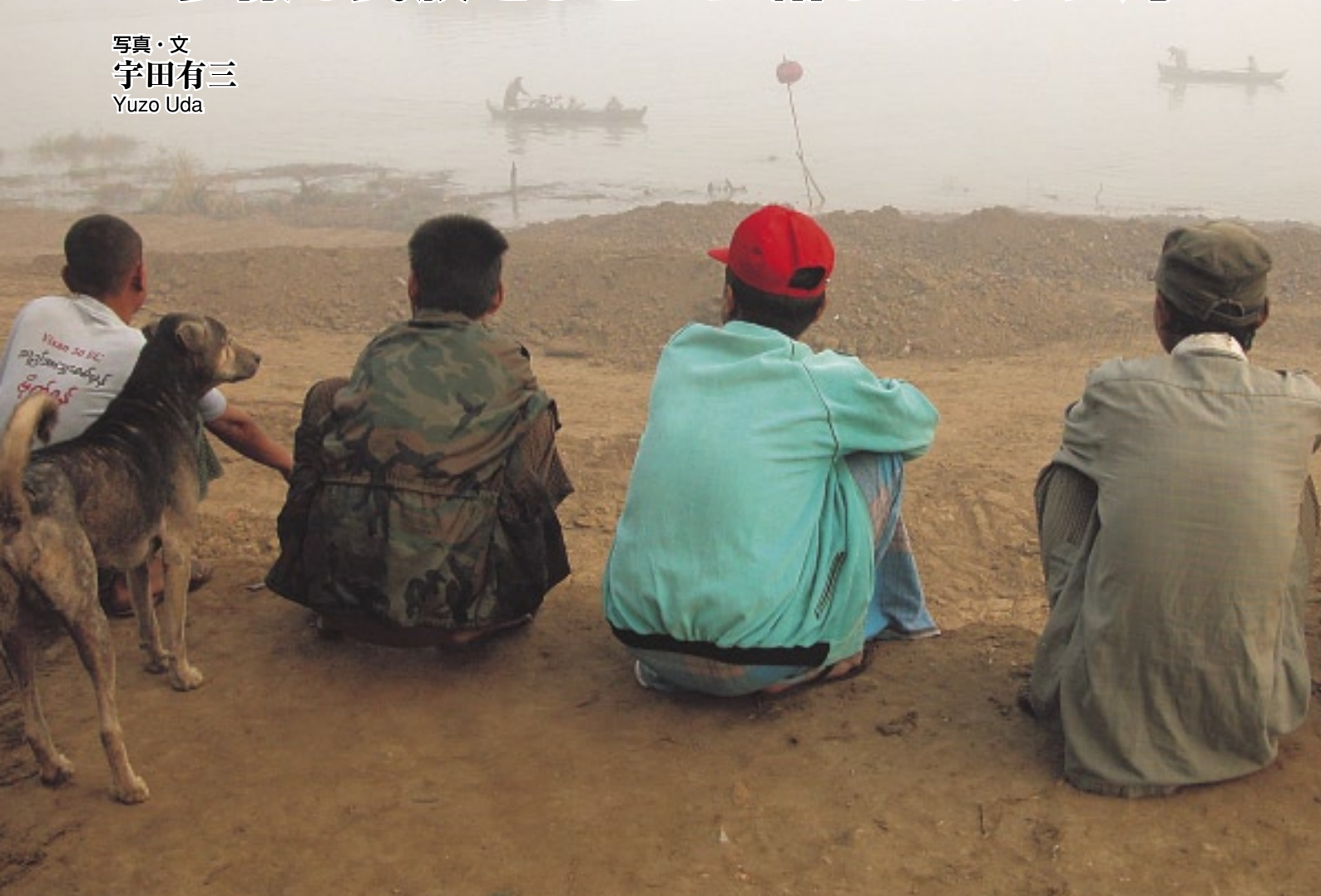
朝早いイラワジ河。霧のかかる河を行き交う船を眺める人びと（イラワジ管区）