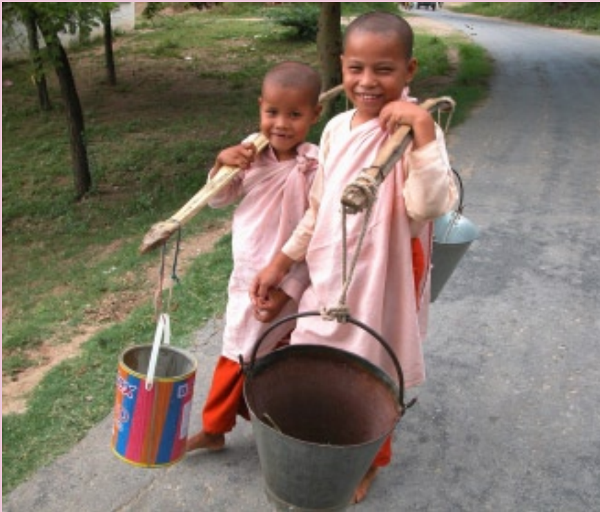
ビルマで最も僧侶の多いザガイン。僧院からイラワジ河まで歩いて約10分。水汲みに出かける尼僧たち（ザガイン）