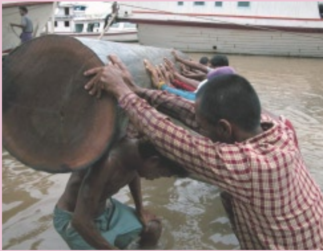
イラワジ河を流してきた材木をトラックに積み込む (マンダレー)