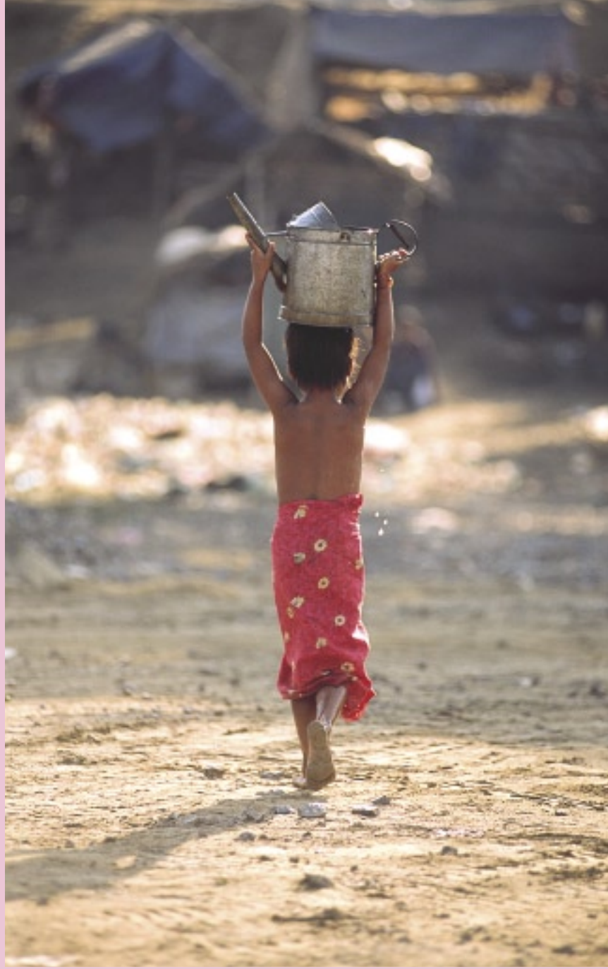
スキップしながら家と河を往復し、水汲み続ける女の子。幼い子どもであっても、家族の中で役割分担を果たす (マンダレー)

権の下で、一般の人びとはどのような暮らしをしているのか。その姿を見てみよう。ビルマ最大の河であるイラワジ河に暮らす人びとの生活を追ってみた。