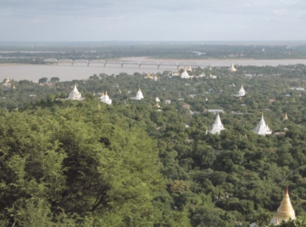
ザガイン丘陵からイラワジ河を見下ろす。悠久の流れとバゴダ（仏塔群）が目前に広がる（ザガイン）