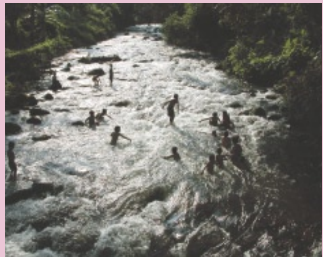
ビルマ最北に位置するカチン州。その州都ミッシーナ近郊のイラワジ河支流で水遊びをする子どもたち（カチン州）

カチン州訪問の目的の一つは、州都ミッシーナから北へ約四五キロに位置するミッソンと呼ばれる地域を訪れ、イラワジ河の出発点を自分の目で確認してみることだった。ミッソンに着くと、マリカ河とメーカ（ンマイカ）河の合流地点に立ってみた。取り立てて特徴のない中州の砂地が目前に広がるだけだった。そう、これこそがイラワジ河の出発点だった。この河が、インド洋につながっているのか。河の流れの穏やかさとこの国の政治の激動は反比例しているような感じさえする。 小さなボートに乗ってマリカ河を遡ろうとしていた人に、聞いてみた。