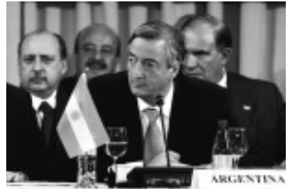
メルコスル・サミットに出席したアルゼンチンのキルチネル大統領