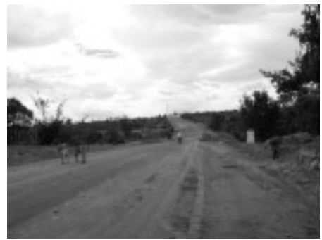
カンボジアの道路 (R48) (2005年12月筆者撮影)

の選定中。④南部経済回廊の一部であるタイのトラート県とカンボジアのコックコンとスレオンバル地区を結ぶ一五二キロの道路(R48)改修工事(八億六七八〇万バーツ)・二〇〇三年七月五億六七八〇万バーツの融資契約、さらに二〇〇四年八月三億バーツの追加融資契約。四つの架橋に関してはグラント供与。現在建設中で二〇〇七年竣工予定。⑤南部経済回廊の一部であるタイのチョンサギヤムとカンボジアのアンロオンウェン、シエムリアップ間の道路(R