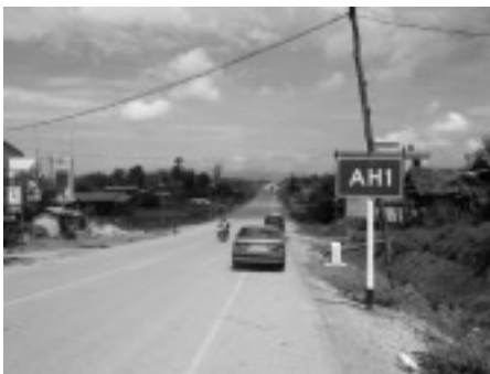
完成済のメソットの道路（2006年7月）