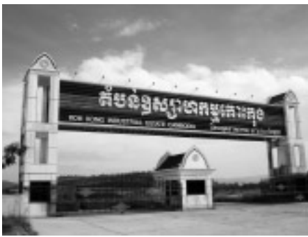
開発中のコココン工業団地

の選定中。④南部経済回廊の一部であるタイのトラート県とカンボジアのコックコンとスレオンバル地区を結ぶ一五二キロの道路(R48)改修工事(八億六七八〇万バーツ)・二〇〇三年七月五億六七八〇万バーツの融資契約、さらに二〇〇四年八月三億バーツの追加融資契約。四つの架橋に関してはグラント供与。現在建設中で二〇〇七年竣工予定。⑤南部経済回廊の一部であるタイのチョンサギヤムとカンボジアのアンロオンウェン、シエムリアップ間の道路(R