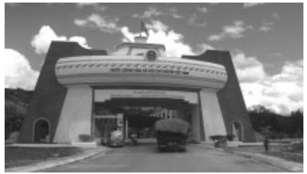
ラオス側からみたベトナムの新通関所

Thailand II EAT)の支援で、社会・環境に対する影響を含む基礎的な調査が実施され、そして収容予定地の住民との交渉が始まった段階であり、具体的な整備に入る前の段階にある。