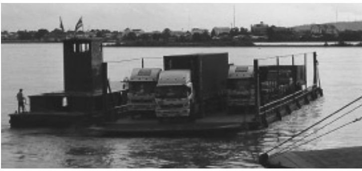
サワナケート・ムクダハーン間の乗り物運搬用連絡船

ーイ及び周辺の県に大きな変化をもたらした。まず、統計でもっとも顕著に現れた変化は橋を渡って、ラオスに入出国する外国人・ラオス人の観光客の数である。橋が完成した翌年の一九九五年にラオスに入国した観光客数は、前年比で一三七%以上増加した。また、二〇〇一年には、国境通行証で主にタイ側へ買い物に出かけるラオス人が、年間延べ一〇〇万人を突破した。橋の完成まではタイからラオスの首都に入る観光客が主に利用するルートは、両国の首都間で運行されていた一日二往復の航空便だけであった。ビエンチャンとノンカーイ間に一日数便の旅客船が運航されていたものの、便数の少なさや運行状況が天候に大きく左右される不便さから利用客のほとんどは小規模な国境貿易を営んでいた両岸の住民であった。そのため、首都ビエンチャンを通じてラオスが受け入れられた観光客は、事実上、航空便が提供できる席数の制約を受けていた。現在、観光客が入国可能となすすべての入国ポイントから年間一〇〇万人以上の外国人観光客がラオスに入国しているが、その半数以上は、第一メコン国際橋を利用した観光客である。この観光客数の増加は、橋の開通に合わせ、様々な規制が緩和されたとはいえ、橋なしでは、達成が極めて困難なものだと言えよう。当局の試算では、観光産業は現在、外貨獲得源としてもっとも大きな貢献をしているとされており、橋が経済全体に与えたインパクト