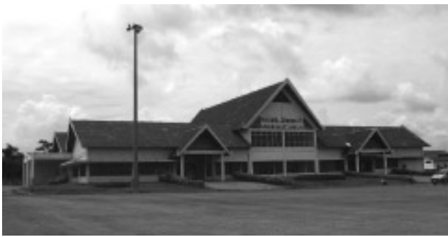
サワナケート空港