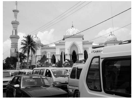
大モスク通りの交差点