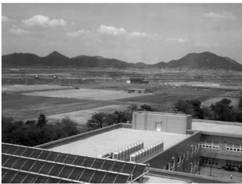
行政都市建設予定地周辺の景観 (2007年3月)

生ずる可能性も否めないため、より長期的な視点に立って再考すべきだとして、当面の首都移転反対を唱える論者もいる。