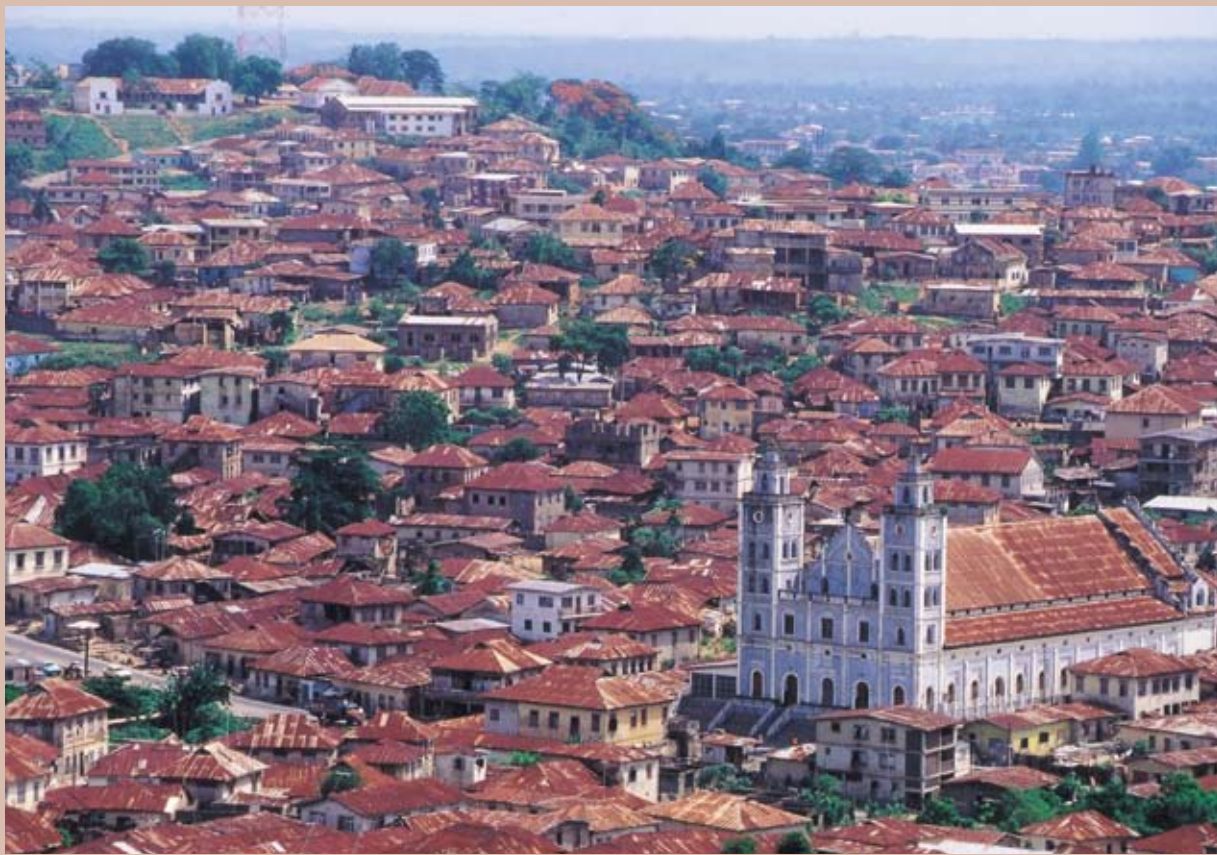
オルモ・ロックから見た アベオクタの街。錆びて 赤くなった屋根が並ん でいる