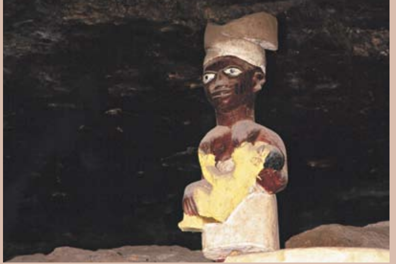
女性が子どもを抱いている像がシュラインの中に祀られていた