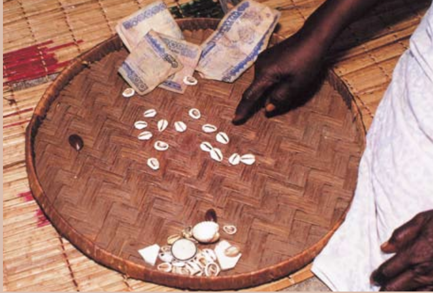
占いをするときには、カウリ（子安貝）が使われる

は、ニセモノの聖職者と区別するためのものだ。近年、ナイジェリアでは、「聖職者」を名乗って、金を目的とした商売をする人が増えている。政府は、ナイジェリアの伝統に根づいた信仰と聖職者を守るために認定状を発行しているのだ。占いが終わってからオルモ・ロックの頂上に登ると、友人は、聖職者から聞いた話をしてくれた。