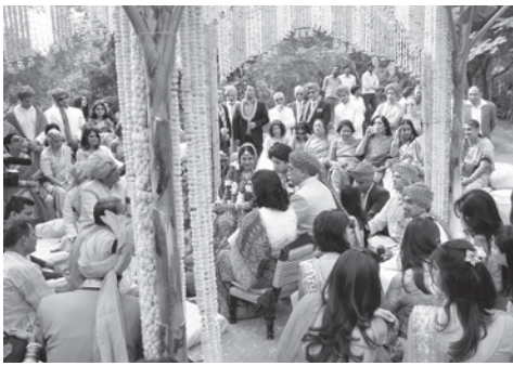
娘の結婚には莫大な費用がかかります。写真はシーク教徒の結婚式