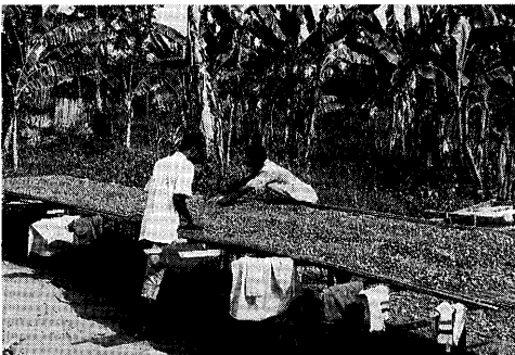
◀ ココアの乾燥作業。乾燥が終わると袋づめにされ、村の買付け会社に持ち込んで販売する。