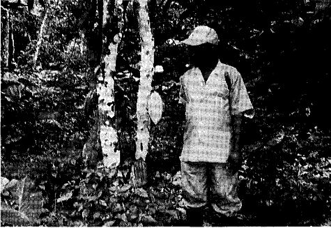
◀ 収穫適期になったココアの実（ポッド）を手にする農民。

ココア・ポッドは1カ所に集められ、共同労働によって中の豆を取り出す作業が行われる（第2章参照）。