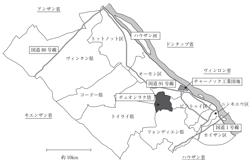
図2 カントー市におけるチュオンラク坊の位置