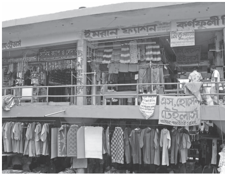
国内消費者向けの衣料品販売 (ダッカ、ニュー・マーケットにて筆者撮影：2008年)

糸や布を生産する繊維産業の歴史に比べて、既製服を生産するアパレル産業の歴史は新しい。かつて衣服は、糸や布を用いて家庭で縫い上げるものだった。第二次大戦後にはアパレル産業が世界的