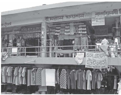
国内消費者向けの衣料品販売 (ダッカ、ニュー・マーケットにて筆者撮影：2008年)

糸や布を生産する繊維産業の歴史に比べて、既製服を生産するアパレル産業の歴史は新しい。かつて衣服は、糸や布を用いて家庭で縫い上げるものだった。第二次大戦後にはアパレル産業が世界的