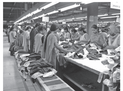
ジーンズ梱包前の最終チェック (ダッカ輸出加工区の工場で筆者撮影：2008年)