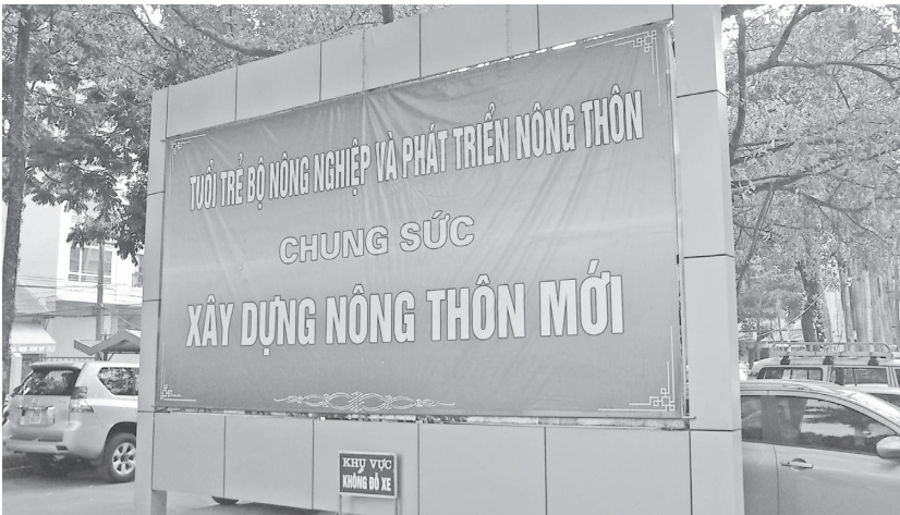
「農業農村開発省若手職員が力を合わせて新農村建設」(2012年10月11日)

議において国民経済における農業・農民・農村の重要性を再認識した、新農村建設の取組みである。新農村建設とは、農村の総合的な基盤整備事業で、文明的・衛生的・近代的な社会基盤を整え、農業生産が市場経済に沿って発展し、農村住民の生活の向上につなげることを目標としたものだ。二〇〇九年より新農村建設パイロツ