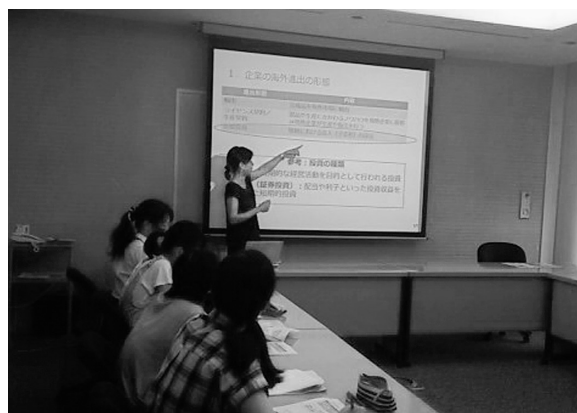
兵庫高校への講義の様子

二〇一五年度より文科省スーパーグローバルハイスクール(SGH)に選定された兵庫高校では、グローバルリーダー育成に向けた事業の一環として「日本企業のグローバル化」をテ