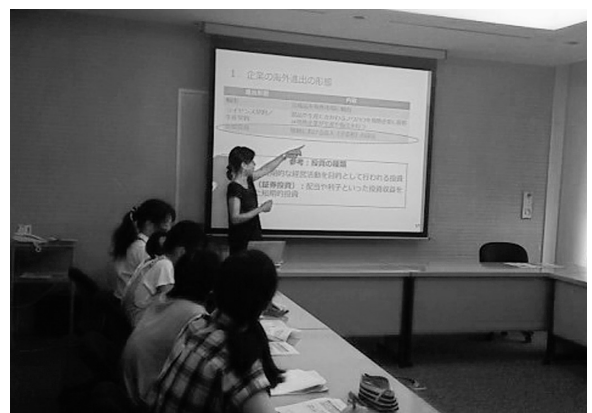
兵庫高校への講義の様子

二〇一五年度より文科省スーパーグローバルハイスクール（SGH）に選定された兵庫高校では、グローバルリーダー育成に向けた事業の一環として「日本企業のグローバル化」をテ