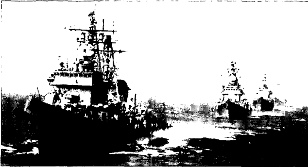
空・海合同演習をする中国人民解放軍のミサイル駆逐艦(WWP)

いう見解が強いが、 ともかく中国のルー ルで香港返還のプロ セスは進行している。