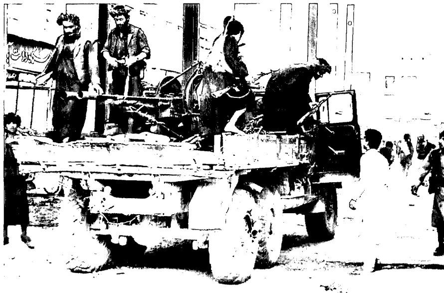
マザリシャリフに進入したタリバーン兵士(WWP)

マレック將軍を外務次官に任命したと発表した。25日、ムラー・ガウス外相代行を団長とするタリバーンの最高幹部で構成された代表団はマザリシャリフに入城した。同時に、マレック將軍が自派の部隊に対し、タリバーンに対する戦闘行為の停止を命じた。タリバーンは、アフガン北西部における最前線から続々とマザリシャリフに進入した。タリバーンの根拠地カンダハールあるいはカブールからもタリバーンの兵士がマザリシャリフに空輸され、アフガン北部に増派された。