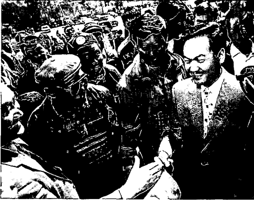
1950年生まれのパガバンディ新大統領(WWP)

パガバンディ勝利の要因としては、政府・与党の急進政策に対する国民の不満の高まりがあった。オチルバト政権発足以来、規制撤廃や行財政改革、公共料金の値上げなど矢継早の政策が急激であったために社会、経済に混乱が生じ、生活改善要求の数千人規模のデモなどが頻発していた。選挙時点ではまだ改革の成果は現れず、与党側は選挙に合わせて公務員等の給与