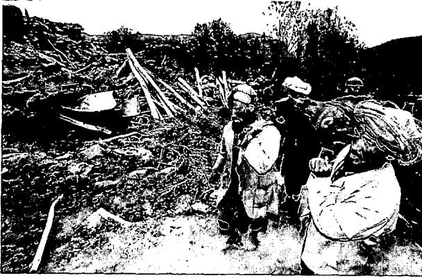
5月の地震被災地で負傷者を運ぶ村民

からのイランおよびトルクメニスタン経由の物資入手が困難となって物価が急上昇した。