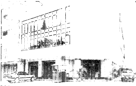
ラン・サーン通りに開店したラオス・ベトナム銀行