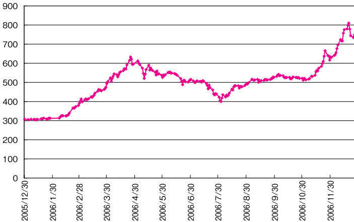
図1 2006年のVNインデックスの推移