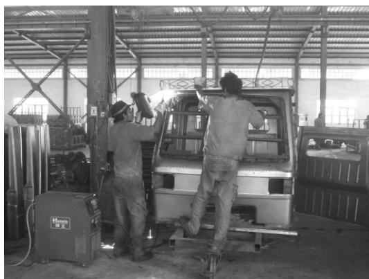
農業用トラクターに載せるキャビンを板金でつくっている。 (2013年8月14日)