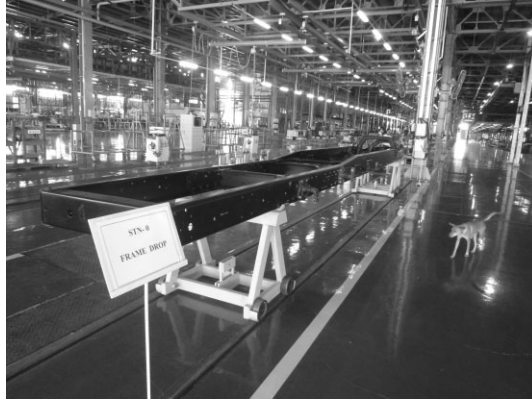
インドのタタ・モーターズの大型トラックのKD生産を行っていたが、注文がなく生産停止に追い込まれた。(2013年12月27日)

この工場はタタ・モーターズのトラックのノックダウン（KD）生産を行っている。注文を受けてから、タタ・モーターズにKD部品を発注し、インドで部品が集められて、船積みされて、ヤンゴン港へ送られる。その後、約500キロ離れているこの工場まで陸送され、組み立てられる。そのため、注文を受けてから車両を納入するまでに、半年から8カ月もかかってしまう。さらに、1ロット12台のため、最低限12台の注文が集まらないと発注さえできない。廉価で品質のよい日本製や韓国製の中古トラックが自由に輸入される現在、半年も待ってまでこの工場のトラックを購入する客はいない。以前は建設省や鉱山省からの注文があったが、今はそうした公的部門からの需要もなくなった。