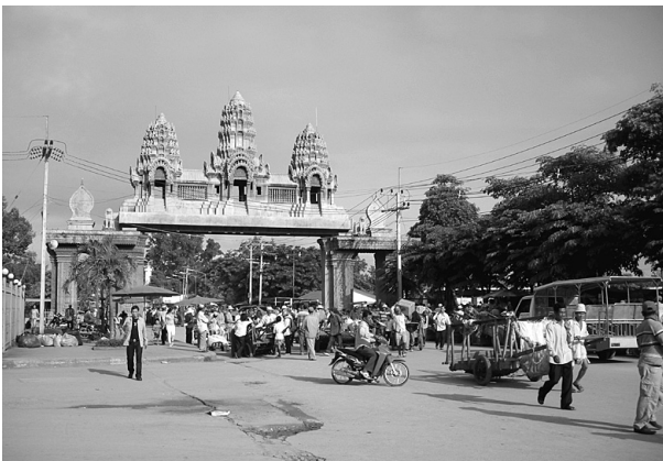
写真1 ポイペト国境の様子 〔2006年10月9日〕