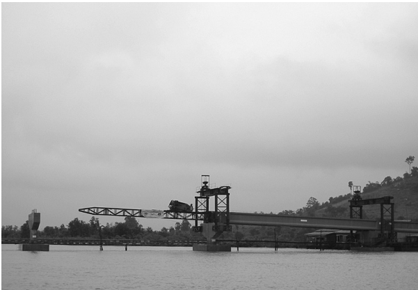
写真2 スラエオンバルでのタイ支援による架橋工事の様子 〔2006年10月5日筆者撮影〕