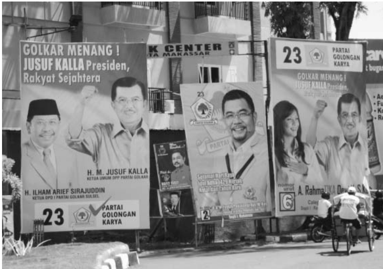
南スラウェシ州マカッサル市内の選挙キャンペーン・ポスター