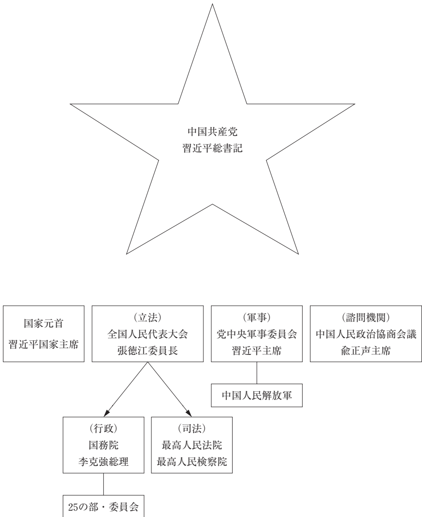
巻頭図1 中国共産党と国家機構