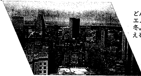
どんよりとしたブエノスアイレスの冬。ラプタ河が見える

の一下級将校が、人権裁判への出頭を拒否したことがきっかけで、これに同調する動きが出始め、4月16日には、首都近郊の軍基地内に120人以上の中堅将校が立て籠もる事態にまで発展した。彼らは、民政下の軍批判に強い不満を現わし、軍人に対する人権裁判の中止、軍首脳の更迭を要求した。マスコミはこの事件をいっせいに報道、民衆は大統領府前の5月広場に続々と詰めかけ、大規模な集会・デモを繰り広げた。ラテンアメリカ諸国からも民政支持の声明が次々に寄せられた。しかし、軍首脳はこの反乱に対処することができず、結局、4月19日、大統領が直接説得に出かけたことにより、事態は一応收拾された。この事件は、現民政下において、軍部内の不満が、場合によっては直接行動に出るほど強いものであること、また逆に、民政の定着にはなお多くの時間が必要であることを国民に印象づけた。その後、5月に入ってから、国内各地で爆発物が仕掛けられる事