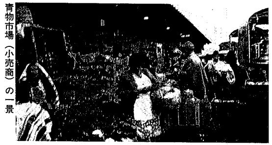
青物市場（小売商）の一角

米の例で示したように、ボゴタで売買・消費される穀類の大半は首都の位置するクンディナマル