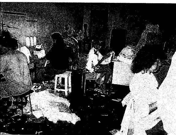
縫製場の光景。仕事場の奥で10歳の男児が糸の仕末をしている

子に支払う賃金は、最低賃金(約1万円)である。家事や育児を手伝うのは、年少の娘や時には失業中の父親である。10歳にもなると男女を問わず、ミシンを踏めるようになる。フリーマーケットの立つ日には学校を休み、自分が縫製したドレスを1レアル(約100円)、2レアルで売り歩く女兒の姿がみられる。それ以下の子どもは、ボタン付けや糸の始末など、縫製の補助的な仕事を受け負う。一家中が何らかの形で縫製業に係わっている。