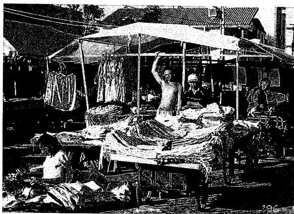
スランカのフリーマーケット。手前の地面で商品を開けている女性は、市役所に道路使用料を払っていない。いわば、インフォーマル・セクターの中のインフォーマルセクターである

零細企業の6割以上は家族労働に依存している。残り4割弱は被雇用者がいる事業所であるが、雇用人1~3人の事業所が65%以上を占めている。要するに、家庭内で行なわれてるインフォーマルな零細事業が、この町のスランカ産業を支えているのである。この家内縫製業なくしては、昼夜2日間のフリーマーケットに、ブラジル各地からバスを連ねて買い付けにやってくる仲買業者の需要に応ずることはできない。