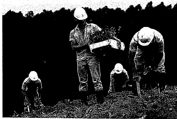
ユーカリ苗木の植林（「セニブラとともに歩んだ25年」日伯紙パルプ資源開発誌より）

芽を咬み切って土中の巣に持ち帰る習性がある。それを細かく噛み砕いてキノコの菌糸を植え付けて栽培し、幼虫の餌にするのである。切り取られる植物の量は、ブラジル中南部では年間1畝当たり8トンを超えることもあるといわれ、ユーカリは導入されて歴史が長くないにもかかわらず、その葉は葉切り蟻にもっとも好まれており、ユーカリ植林地ではこの蟻の被害に頭を悩ませている。