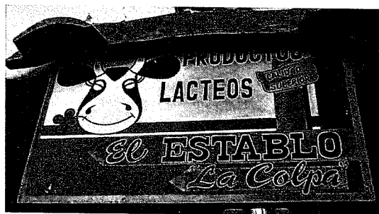
カハマルカ市郊外、コルパ農場の直売所(上)とアルプス農場のチーズ工場(左)

観光客の増加を目指して、従来の観光地の振興はもちろん、新しい観光資源の開発も行なわれている。本稿ではそのうち、農業や農村の開発と観光を結びつけた「アグロツーリズム」を取り上げ、政府機関や大学、開発援助機関による試みを紹介する。