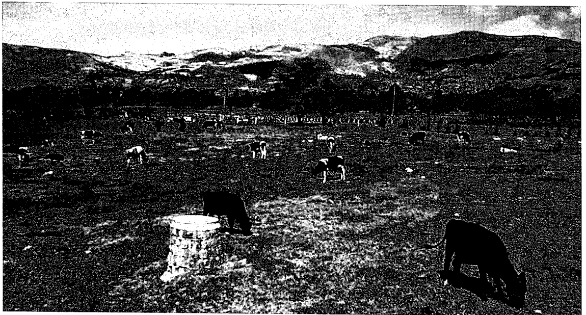
カハマルカ市郊外の牧草地

観光基盤の整備とともに増加し、その数は99年には90万人に達した。しかしこの数字はメキシコの1900万人やブラジルの510万人はもちろん、チリの160万人と比べてもかなり少ない数字である*。今年7月末に発足した新政権は観光の振興を重点課題としており、5年のうちに外国人観光客を300万人まで増やすことを目標としている。