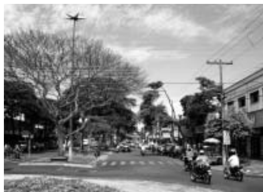
ドウラードスの中心街

ドウラードスのある南マット・グロッソ州(以下、南マ州)は、1977年にマット・グロッソ州から分離して新設された州であるが、面積は35万8159平方キロメートルで日本の国土37万7835平方キロメートルにほぼ匹敵する広さを有する。一方で、日本の人口密度が約336人/km 2 (2002年)であるのに対し、同州は約5.8人/km 2 (2000年)であり、ブラジル全体の約21人/km 2 (2002年)よりも少ない。同州の名称にある“Mato Grosso”とは、日本語に直訳すると“鬱蒼とした原始林”という意味である。以前はその大地が深い原始林に覆われていたのが、現在は一面広大な畑や牧場が広がる、ブラジルでも有数の農業生産地となっている(表1)。