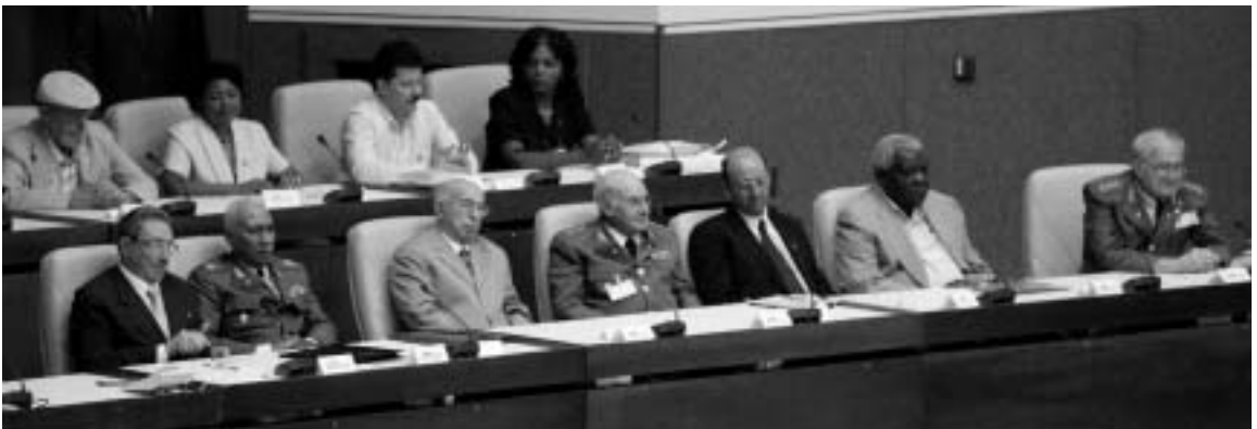
ラウル・カストロを首班とする新指導部の顔ぶれ。2008年2月24日政権発足時、全国人民権力議会議場にて。前列左から、ラウル・カストロ、フアン・アルメイダ、ホセ・ラモン・マチャド、アベラルド・コロメ、カルロス・ラヘ、エステバン・ラソ、フリオ・カサス。後列左から、国家評議会メンバーのロベルト・フェルナンデス＝レタマール、イリス・ベタンクール＝ティエス、フリオ・マルティネス＝ラミレス、スリーナ・アコスタ＝ブルック。

2008年2月19日、フィデル・カストロは共産党機関紙『グランマ』に、国家評議会議長と革命軍最高司令官の地位を退く、と発表した。発表は、立法府全国人民権力議会(国会)が総選挙後初めて召集され、新たに選ばれた議員の中から、国家評議会の構成員およびその議長が選出される5日前に出された。そして2月24日の国家評議会で、1976年に国家評議会が設立されて以来30年以上にわたってフィデルが務めてきた国家評議会議長の地位は、それまで同第一副議長であった実弟ラウル・カストロに移った。これで制度上は、フィデル・カストロは引退し、ラウル・カストロ新政権が誕生したことになる。