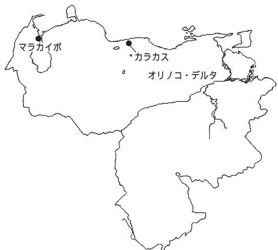
図1 ベネズエラの産油地域

ベネズエラの石油産業は、生産の低迷と、商業価値の低い(10年前までは商業ベースにのらなかつた)超重質油への依存という二つの問題を抱える。生産の低迷の理由は、多くの既存油田では生産の歴史が長く、生産性が落ちてきていること、そしてそれらの既存油田を維持するためのメンテナンス投資および新規油田の開発投資が停滞していることにある。石油は、生産が進むほど地層内の圧力が低下するため、水やガスを地層内に注入して圧力を上げないと汲み上げられなくなる。すなわち石油産業は、生産量が蓄積されるほど追加技術が必要で生産コストが高くなる、費用逦増産業であると言える。マラカイボを中心としたベネズエラの既存油田(図1)の大半は生産開始から長期が経過しており、常時メンテナンス投資をしなければ生産性が急速に落ちる。