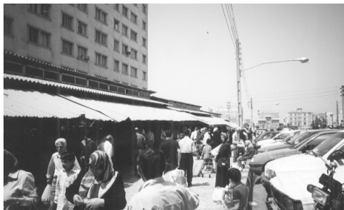
シャフラケ・ガルブのパーザーレ・ルーズ