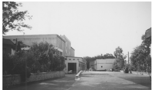
テヘラン食肉卸売市場の冷凍施設