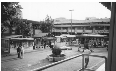
ファルマーニーエの複合施設