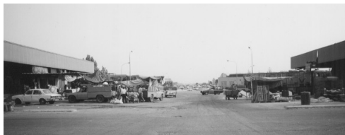
大テヘラン青果中央卸売市場