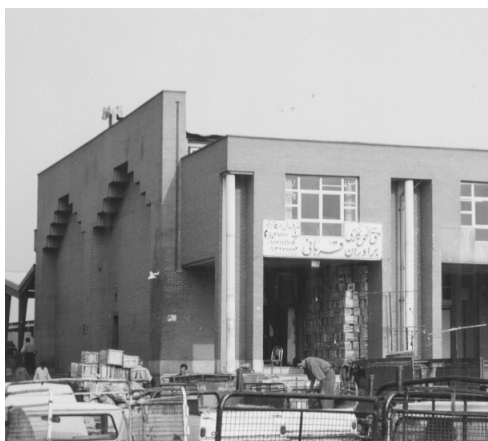
「ハッゴルアマル・カーリー」の看板

さて新市場における市政府の役割については、おおむね以下のようにまとめられる。市場の土地・建物 (倉庫・管理舎屋など) は市