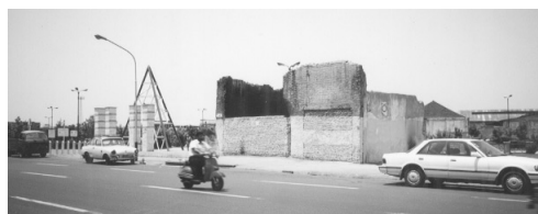
シューシュ広場そばの市場跡地