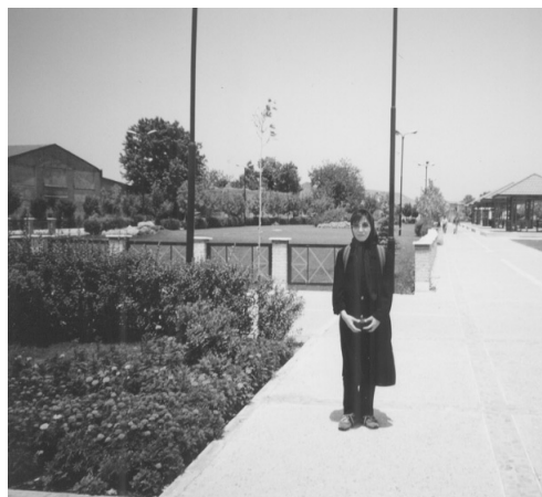
現在公園となった跡地