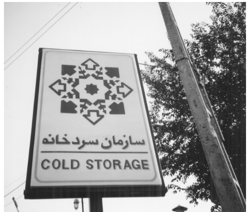
「冷蔵庫機構」の表示