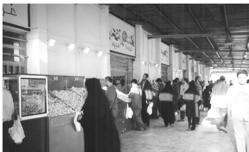
複合施設内のパーザーレ・ルーズ

類の公設市場がある。これまでに紹介したように、それぞれの市場における市政府の関与の度合いは互いに異なっている。すなわち卸売市場に対しては市政府は専ら市場の開催（場所・入居者の確保）のみに責任を負っているのに対して、小売市場に対しては、商品の価格設定に一定程度の規制をもうけ、より