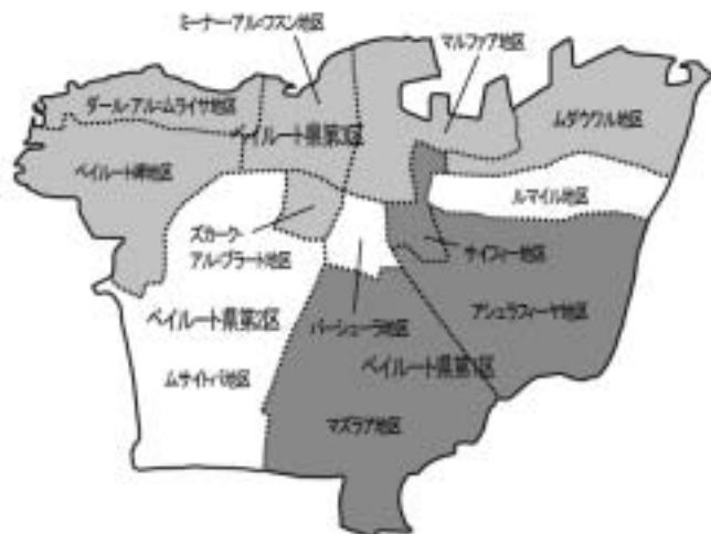
ベイルート県(拡大図)

なお, 選挙戦を勝ち抜いた候補者たちが, 新期国会の招集とともに結成するのがブロックであり, 有力政党・政治組織メンバーとその支持者によって構成される。