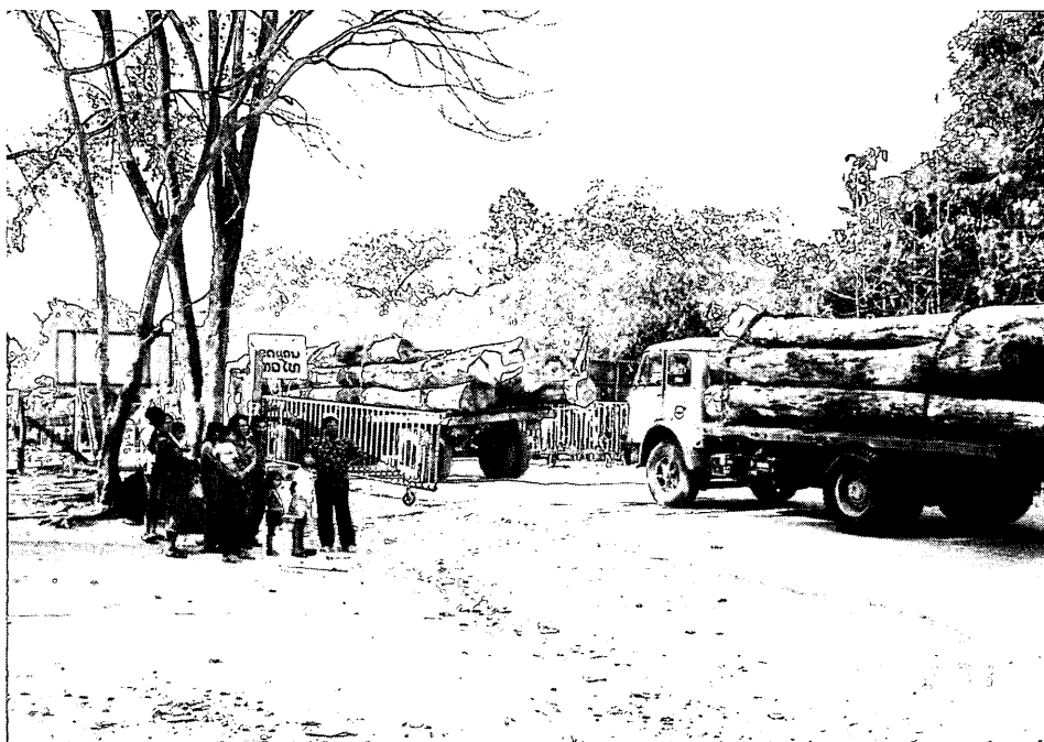
ラオス・タイ国境地点 チョンメク