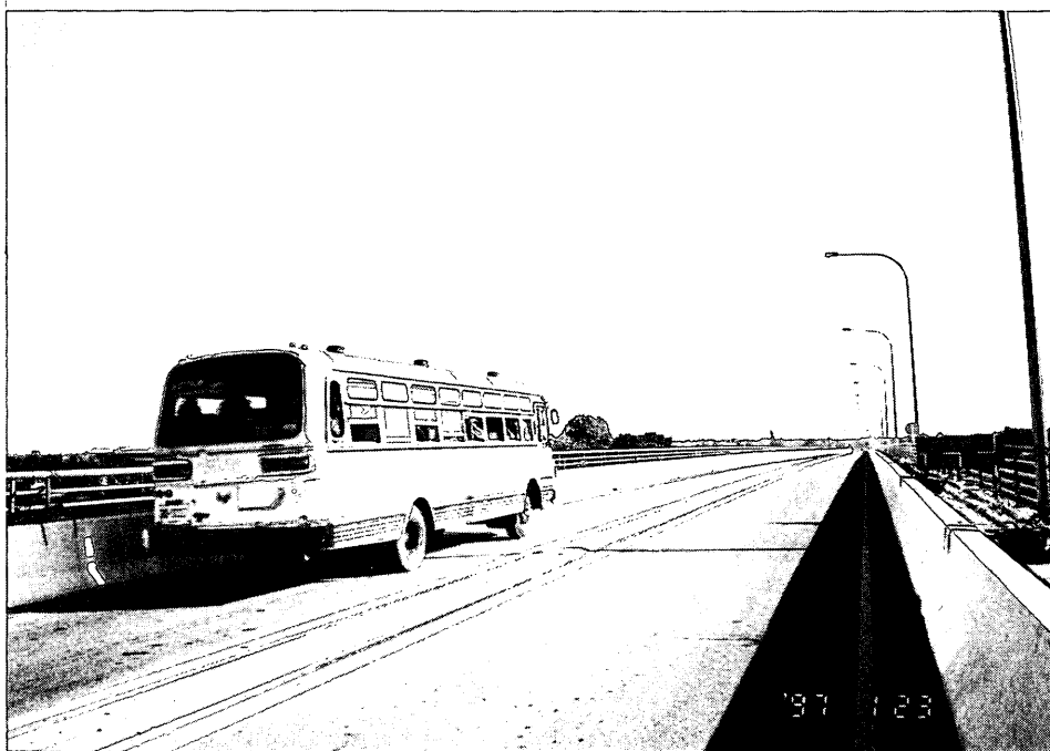
タイ・ラオス友好橋