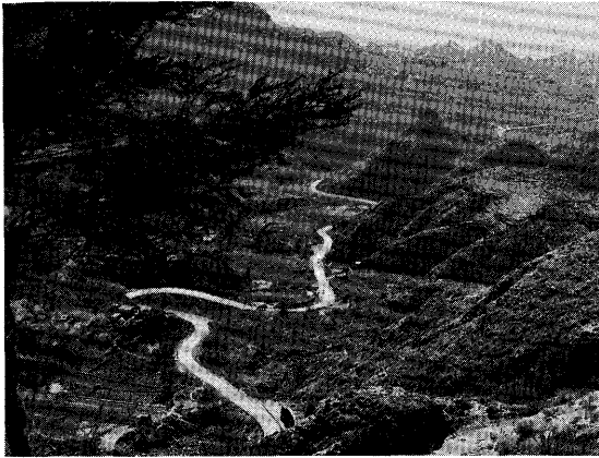
山岳道路——これはイエメンの中ではカーブも少なく傾斜もゆるい部類である。