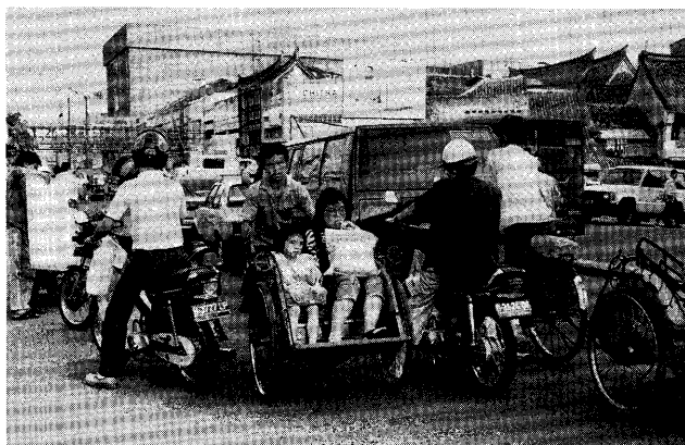
市場での買物客を送るベチャ

けて玄関まで送る、というぐあいである。こういう時は、何がしかのチップをはずまねばならないが、これほど行き届いた乗り物は他に類例をみない。