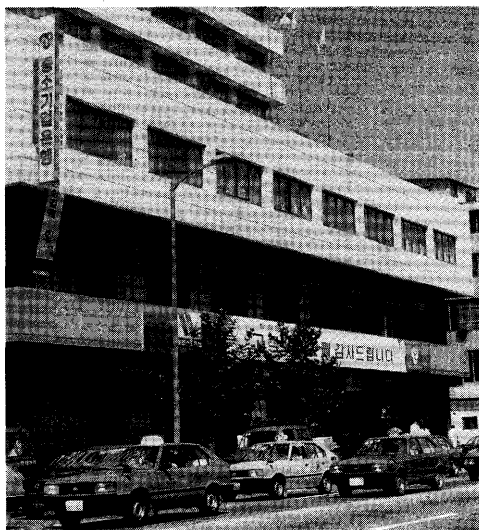
ソウル市内を走るタクシー