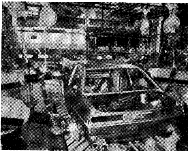
ロボットによる自動車組立