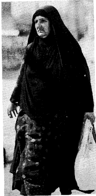
イラン南部フーズスターン州の町シーランなど異 シュで。袖口の形状などテヘランはまったく風通しが で見かけるチャードルとはまた風通しが なるもので、動きやすくまた風通しが 良いように工夫されている。