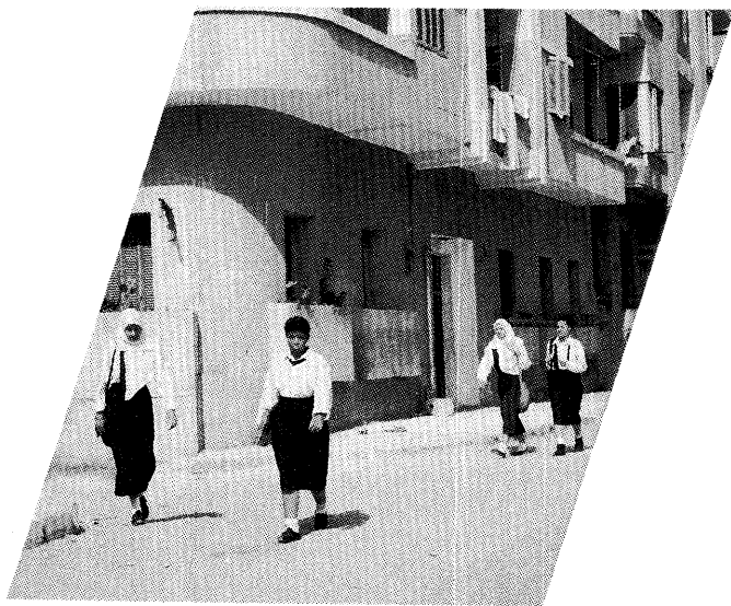
カイロ市内の通学風景