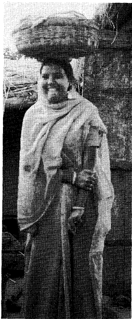
北インド農村の働くサリー。 バングル売りの行商人 (1983 年、ビハール州で)

れているのに、横に並ぶ花婿は、少なくとも都市部では洋装の方が多し。むしろ家庭でのくつろぎ着として以外に男性が伝統着を着用するときは、そこになにがしかの意味が含まれているように見える。