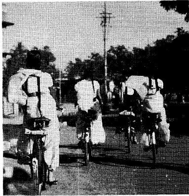
自転車もさっそうと。お下げ髪の 女学生のサリー