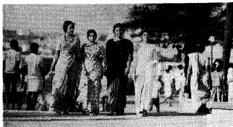
海風にサリーをはためかせて（1970年代初め，マドラス，マリナー・ビーチ，撮影：松谷賢次郎）

婚の女性たちについてみると圧倒的に「伝統的」衣服が主流である。若い女学生の間ではジーンズ姿が定着し、スカート姿もちらほら見かけるようになった今日でも、既婚の成人女性の洋装がさほど珍しくないのは、ゴアやボンベイなど一部の都市くらいであろう。着物と伝統の関連には、性差の問題が深くからんでいるようだ。